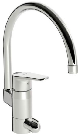
Oras Safira 1039