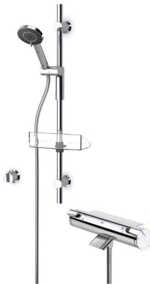
Oras Optima 7149