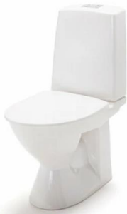
Ido Seven D/Glow