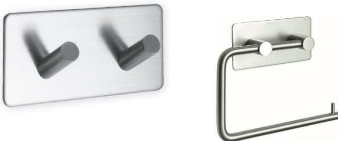
Urakkaan kuuluvat koukustot, urakkaan kuuluu 2- ja 4-osainen pyyhkekoukku ja wc-paperiteline.