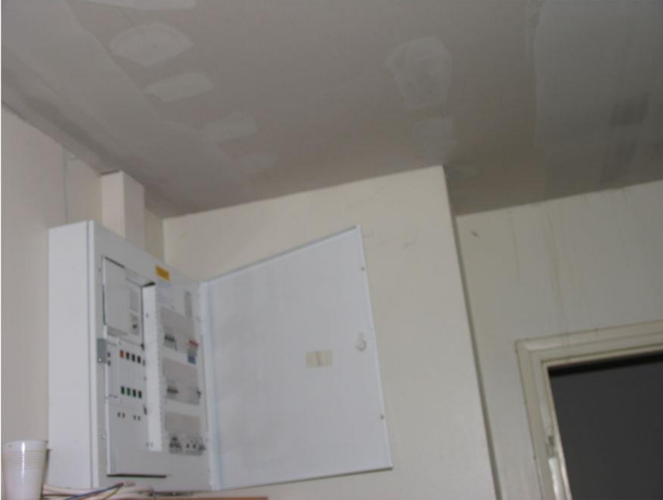
Asuntoon asennettava uusi huoneistokeskus