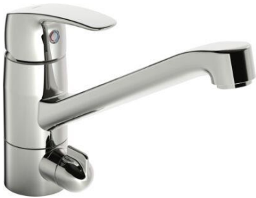
Oras Safira 1035F