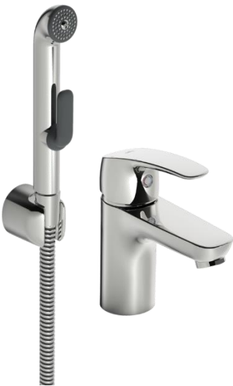
Oras Safira 1012F