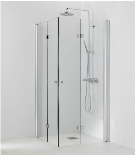
Urakkaan kuuluva suihkunurkka, Vihtan Ocean 5+5