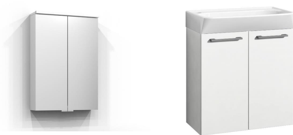
Urakkaa kuuluvat kalusteet, allaskaappi ja peilikaappi led valolla, Svedbergs Bloc